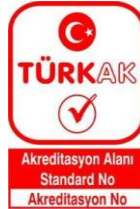
Şekil 2: TÜRKAK Akreditasyon Markası

TÜRKAK Akreditasyon Markası: TÜRKAK tarafından akredite edilmiş kuruluşların akreditasyon statülerini göstermek için kullandığı semboldür. Akreditasyon Markası TÜRKAK logosunun altına akreditasyon alanı, akreditasyona konu olan standardın numarası ve akredite edilmiş kuruluşun akreditasyon numarasının eklenmesi ile oluşturulur.