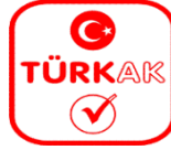
Şekil 1: TÜRKAK Logosu

TÜRKAK Logosu: TÜRKAK'ın kendi ismini veya akreditasyon programlarını tanıtmak için kullandığı sembol